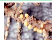
↑ ジャガイモシストセンチュウ

様々なリスクや環境の変化への対応力強化・生産性向上による 持続可能な畑作生産体制の確立に向けた取組を支援