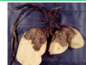
↑ サツマイモ基腐病