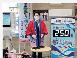
【カウントダウンボード(道庁本庁舎1階)】