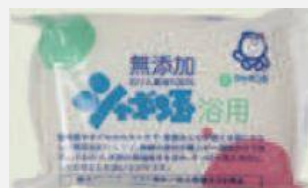
【協賛品(提供:厚岸町)】