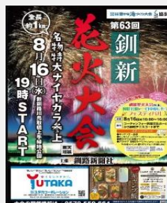
【釧路新聞花火大会】