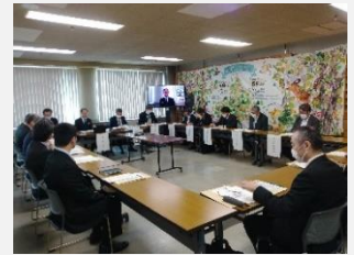
【第6回幹事会開催状況】