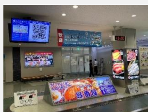
【たんちょう釧路空港】