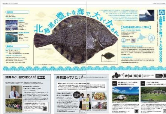
【広報ほっかいどう9月号】