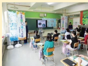
<栽培漁業の学習> 【厚岸小学校】