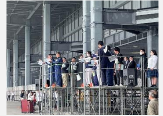
【1ヶ月前リハーサル】