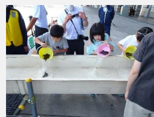
<マツカワ放流> 【厚岸町立厚岸小学校】