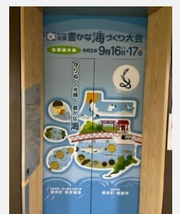
【道庁エレベーター】