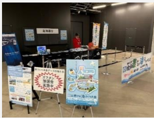
【プロ野球 北海道日本ハム戦】