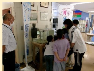
<水槽設置> 【泊小学校】