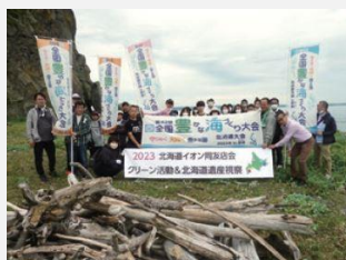
【海の環境レスキュー隊(厚岸町)】