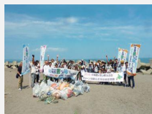
【小清水町 海岸清掃】