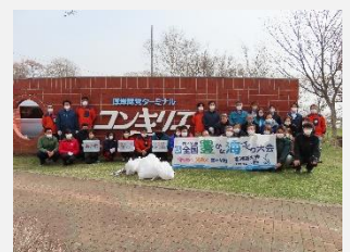
【道の駅クリーンアップ】