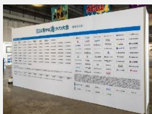
【協賛ボード(大会会場)】