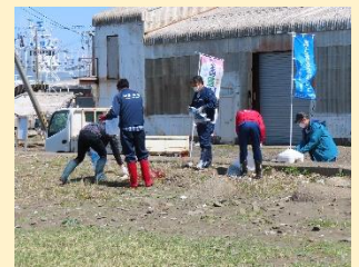
【バラサン岬 海浜清掃】