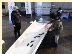
<ヒラメ放流> 【瀬棚小学校】