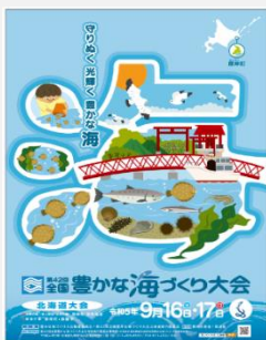
【大会公式ポスター】

※LASBOSカード:北海道大学の水産オンライン教材内の動画教材をコレクション化したもの