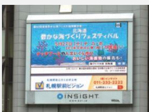
【札幌駅南口 街頭大型ビジョン】