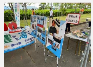
【北のピーナス露まつり】