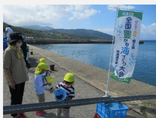
<ヒラメ放流> 【せたな町幼児】