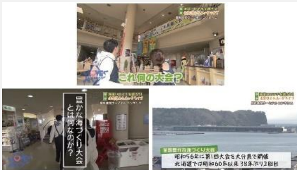
【HTB LOVE HOKKAIDO(R5.6.17放送)】