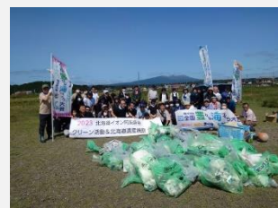
【白老町 クリーン活動】