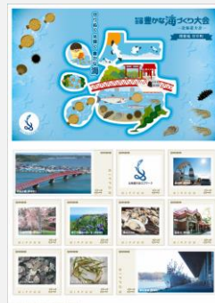
【オリジナルフレーム切手】