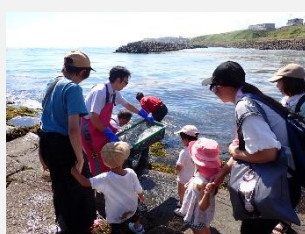
<マツカワ放流> 【えりも以東海域栽培漁業推進協議会】