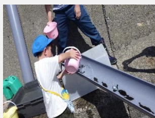
<ヒラメ放流> 【小樽市立高島小学校】