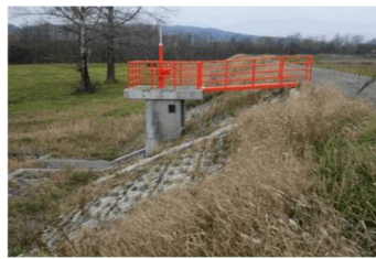
樋門・樋管(徳富川)