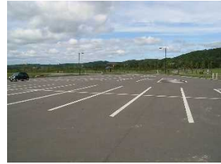
便益施設 （サンピラーパーク 駐車場）