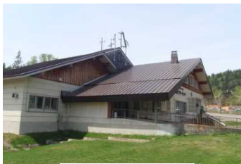
博物展示施設 (勇駒別)