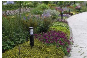
修景施設 （道南四季の杜公園 花壇）