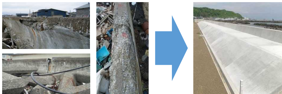
海岸護岸の老朽化対策