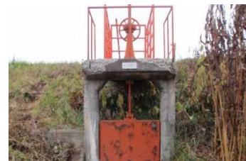
樋門の老朽化状況 (扉体の塗装劣化)