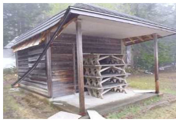
小屋の老朽化状況