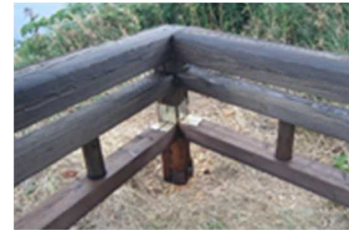
防護柵の修繕状況