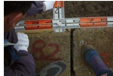
海岸護岸のクラック点検状況