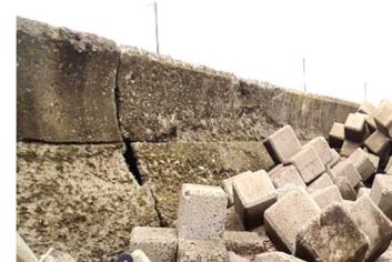
海岸護岸の老朽化状況