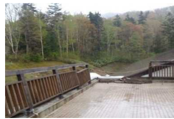
屋上柵の老朽化状況