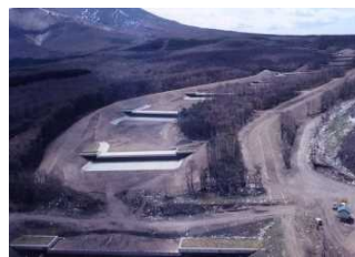
床固工群 (砂原押出沢川、森町)