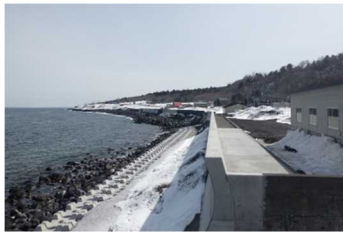
海岸護岸(利尻富士町)