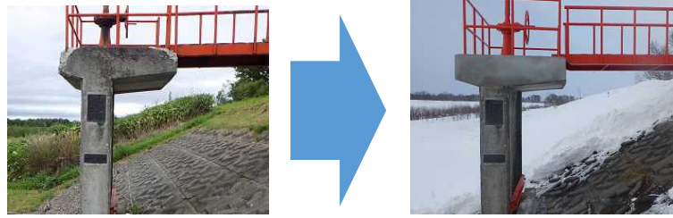
樋門(門柱部)の補修状況