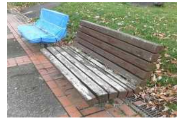
ベンチの老朽化状況