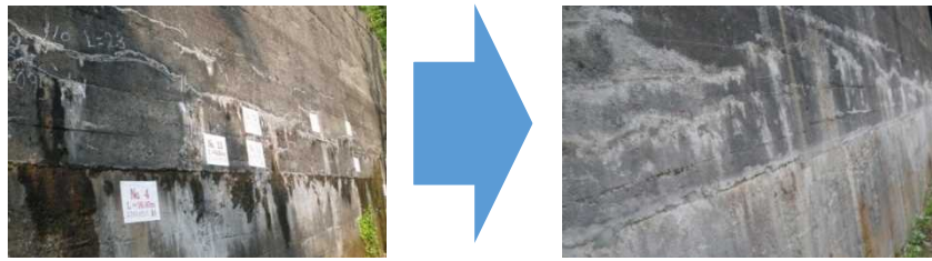
砂防堰堤の漏水対策(注入工)