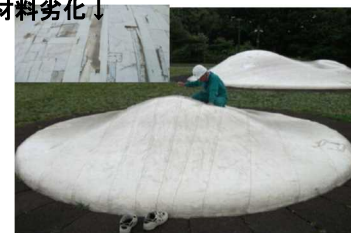
遊戯施設の点検状況