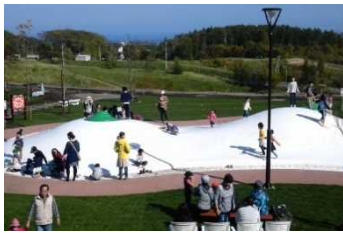
遊戯施設 （オホーツク流水公園 ふわふわドーム）