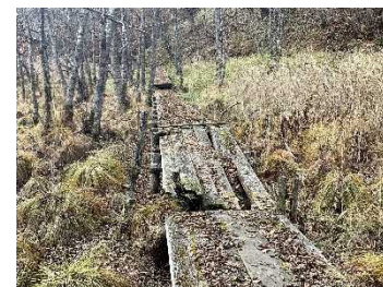
木道の老朽化状況