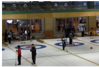
運動施設 （サンピラーパーク カーリング場）