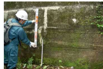
砂防堰堤のクラック点検状況