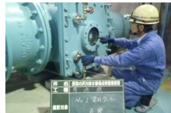
排水機場排水ポンプの点検状況