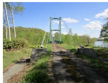
橋梁 (青山ダム地区 もりりん橋)