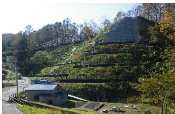
急傾斜地崩壊防止施設 土留柵工 (小樽天神3丁目3、小樽市)