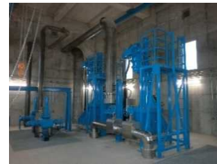
放流設備(放流バルブ)