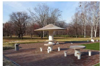
休養施設 （真駒内公園 ベンチ・四阿）