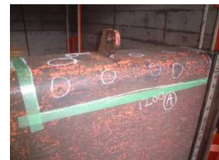
取水ゲートの老朽化状況