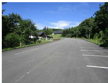
道路・付帯施設等 (神居尻地区)