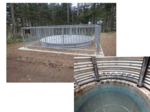
地すべり防止施設 集水井工 (緑町、紋別市)