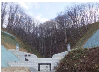
砂防堰堤 (右の沢川、網走市)