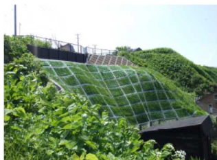
急傾斜地崩壊防止施設 法枠工 (泊泊村 16、泊村)