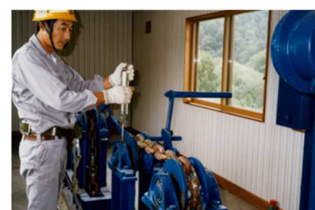
ゲート長休止装置の点検状況