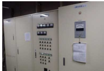
電気設備等 (神居尻地区)