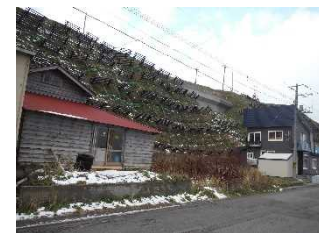
雪崩防止施設 予防柵工 (礼文白浜、礼文町)