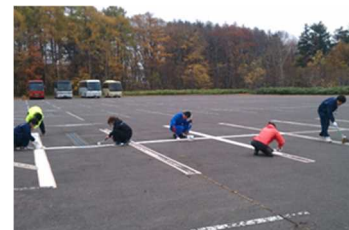
職員研修 (駐車場白線補修)