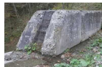
砂防堰堤の老朽化状況