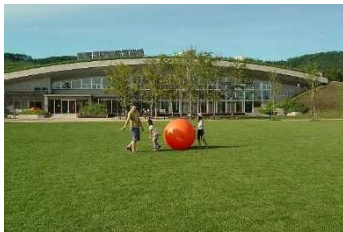
園路広場 （十勝エコロジーパーク 芝生広場）