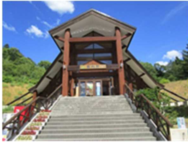
建物・小屋等 (神居尻地区 多目的管理棟)

道民の森 1箇所6地区(建物・小屋等、電気設備等、道路施設等、橋梁 等) (令和3年3月末 現在)