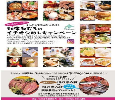
知床ねむろのイチオシめしキャンペーン

新型コロナウイルス感染症の影響で大きく減少した観光客のいち早い回復に向け、豊かな自然や食の資源を活かした取組を実施しています。食の高付加価値化やねむろブランドの確立を図るため地域資源の創出と発信を行うほか、観光客の回復に向けて、道内外で観光プロモーションを実施し、管内の豊かな観光資源などをPRしていきます。