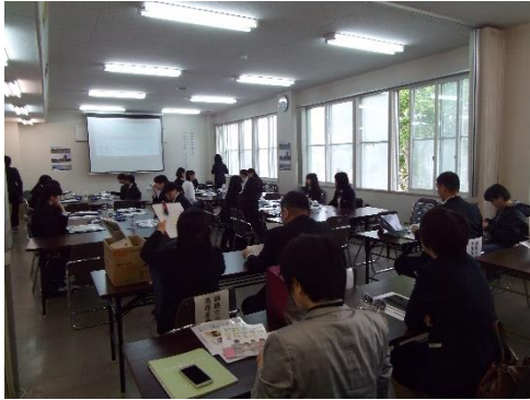
※イメージです。 実際はWeb開催になりました。