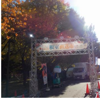
札幌市内のイベントと ロール寿司リーフレット