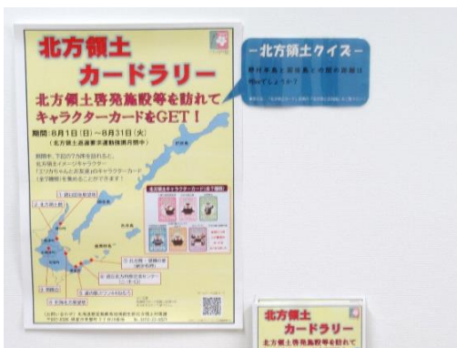
北方領土カードラリーの様子

また、元島民の平均年齢が86歳を超え、返還要求運動を引き継ぐ後継者の育成が課題となっていることから、根室管内の高校生が領土問題に対する興味・関心を持つきっかけ作りを推進しています。