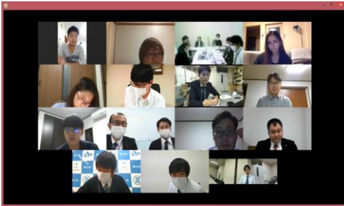
令和3年度第1回ワカモノ会議（食と観光編）

根室管内においては、全道平均を上回るスピードで人口減少が進んでいる現状です。そこで、人口減少社会における新たな視点での活力ある地域コミュニティづくりが必要なことから、地域人材のネットワークづくりや多文化共生社会の推進などの取組を通じ、持続可能な地域コミュニティづくりを行います。