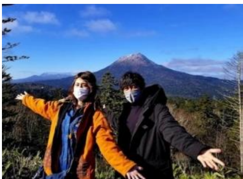
インフルエンサーツアーの様子