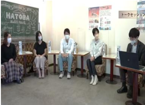
移住・定住オンラインサロンの様子