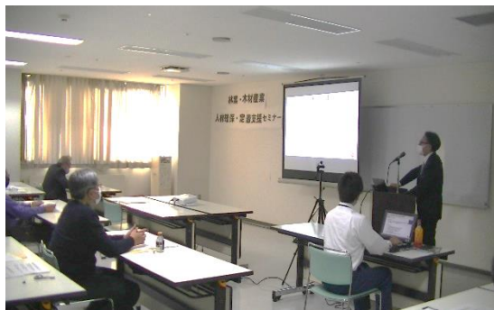
林業・木材産業人材確保・定着支援セミナーの様子