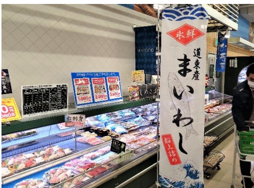
マイワシフェア期間中の量販店鮮魚売り場の様子