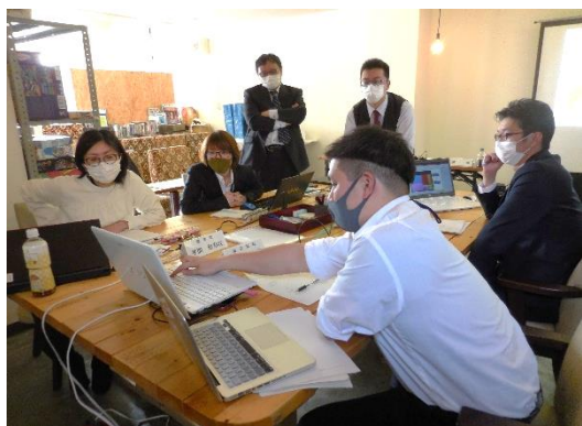
グループディスカッションの様子