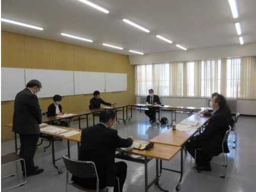
有識者懇談会の様子