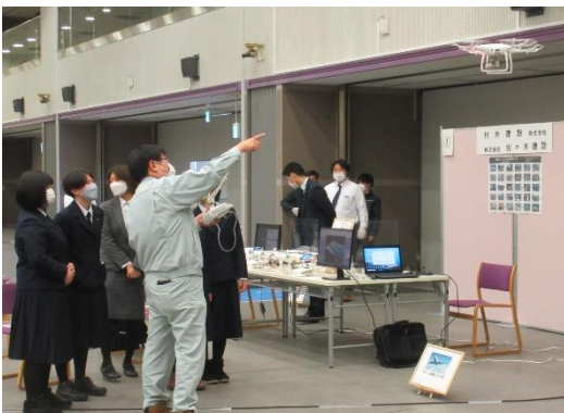
就職フェアの様子