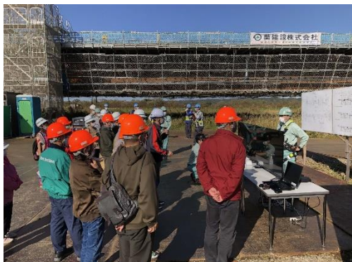
道東道現場見学会の様子