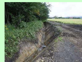
外注による水路の泥上げ