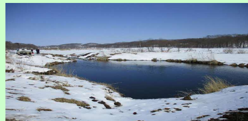
土砂を沈殿させ湿原へつながる河川に排水して、湿原への土砂流入を抑制している。(土砂上げ後) ※ 令和2年度 土砂浚渫量 544立法メートル