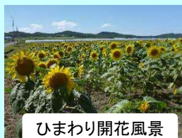
ひまわり開花風景