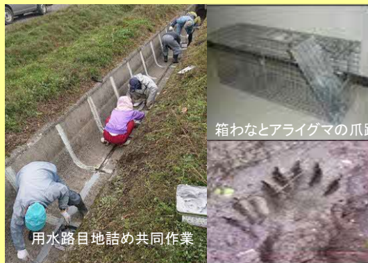
箱わなとアライグマの爪跡