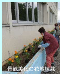
景観美化の花壇植栽