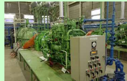
排水機場の負荷軽減