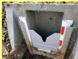
田んぼダム用堰板

降雨時は、V字部分の断面に応じて排水されるため、堰板操作が不要。（最大で10cmの雨水の貯留が可能）