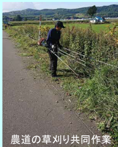
農道の草刈り共同作業