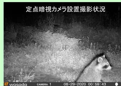
定点暗視カメラ設置撮影状況