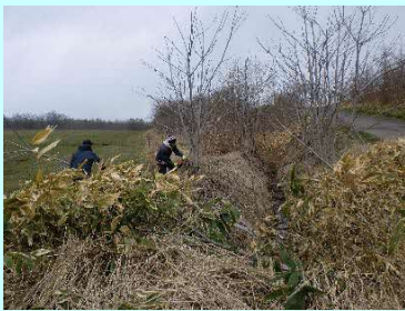
農道側溝の雑木伐採