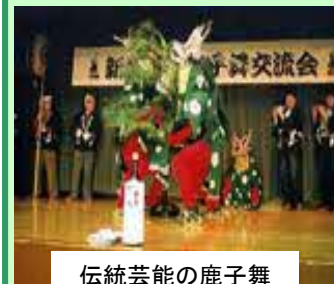
伝統芸能の鹿子舞