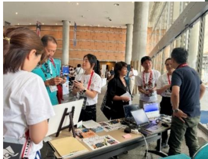
サポートデスクでの様子