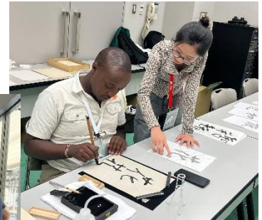
書道講座で参加者を補助