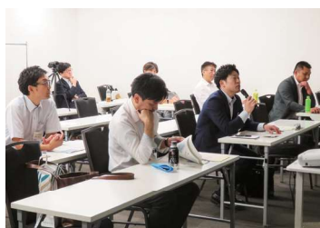
講義の回数を重ねるごとに 質疑応答が活発になっていった。

ヘルシーDo創造塾では、計12名の講師から、道産食品に秘められた機能性や科学的エビデンスを評価する重要性、機能性に着目した商品開発事例やマーケティング論も含め、機能性食品の開発・販売に求められる視点等について解説があった。受講生はこれらの知識を習得し、講師との人的ネットワークも構築した。