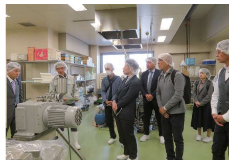
第7回見学会の様子。実際の試作加工製造現場に 訪れることで、商品開発のイメージが膨らんだ。