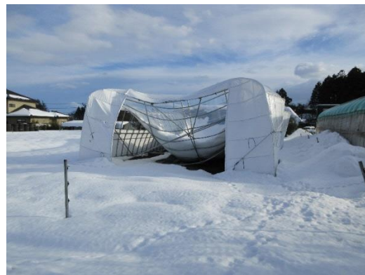
大雪によりパイプハウスが全壊(色麻町)