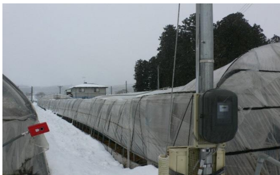
雪の重みでパイプハウス(いちご)が倒壊(一関市)