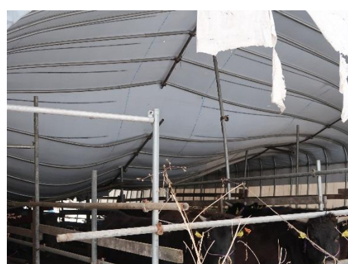
雪の重みで牛舎の屋根が変形(大崎市)