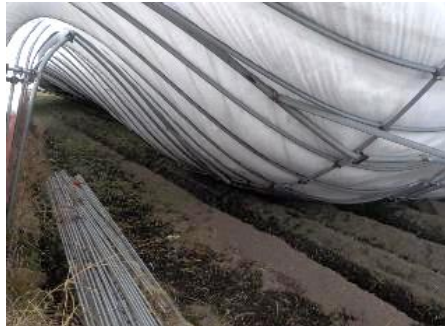
積雪により収穫後のハウスが倒壊(青森市)