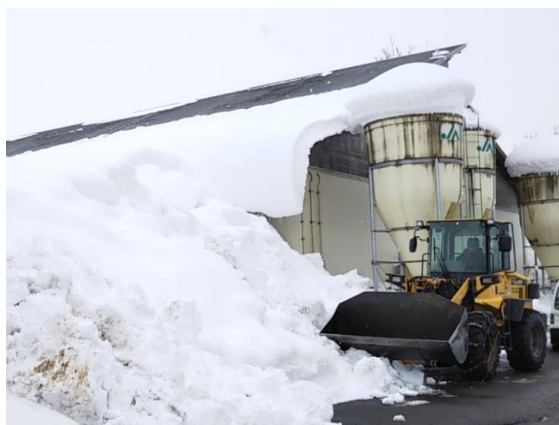
大雪により牛舎の壁が圧迫され変形(尾花沢市)