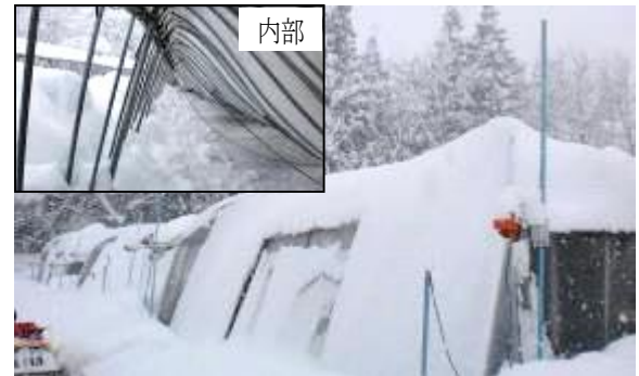
雪の重みでパイプハウス(水稻育苗)が多数倒壊(金ケ崎町)