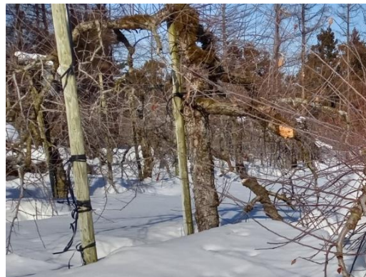
大雪により樹体(りんご)が枝折れ(色麻町)