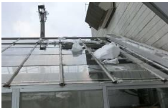
雪の重みでガラス温室の屋根が破損(金ケ崎町)