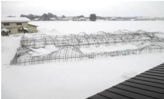
雪の重みで骨組のみのパイプハウスが多数倒壊(北上市)