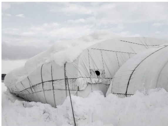
雪の重みでしいたけ栽培ハウスが全壊(大蔵村)