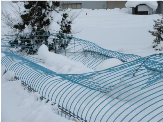
被覆のないパイプのみの育苗ハウスも多数被害(大仙市)