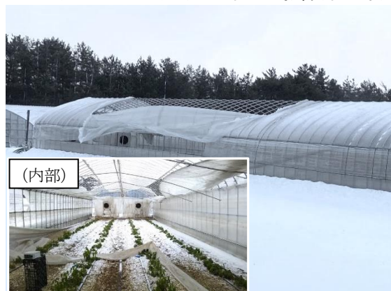
強風によりパイプハウス被覆資材が破損し、 花き(アルストロメリア)の生育にも影響(酒田市)