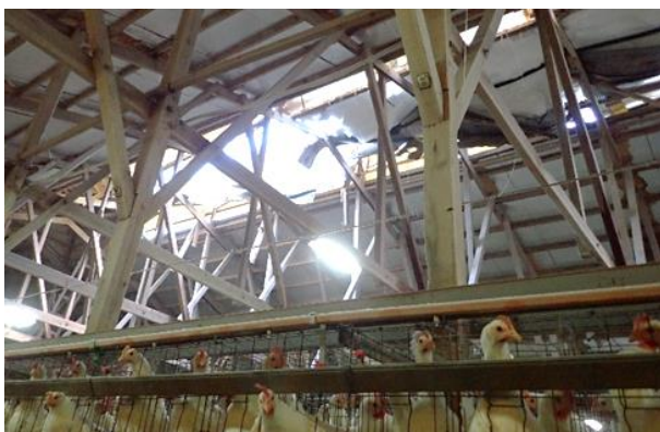
大雪により鶏舎の屋根が損壊し、 早急な鳥インフルエンザ対策が必要(関川村)