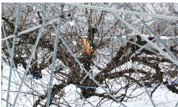
雪の重みでパイプハウスが倒壊し、 さくらんぼ樹体にも被害(東根市)