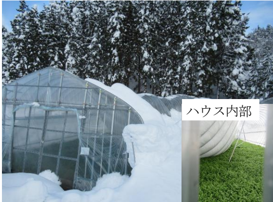
ハウスが倒壊し、せりが収穫不能(湯沢市)