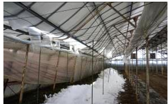
雪の重みで鉄骨ハウスが破損(奥州市)