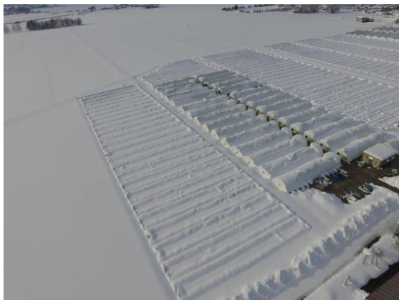
大規模ほうれんそう団地が壊滅的被害(横手市)