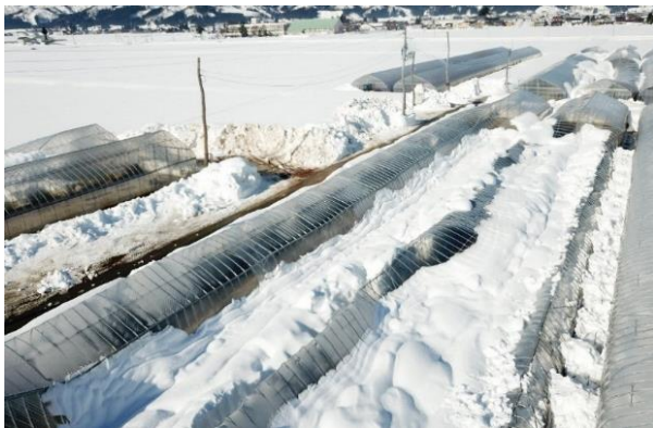
雪の重みにより JA 水稻共同育苗ハウスが倒壊 (南魚沼市)