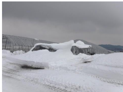
積雪によりパイプハウスが損壊 (三笠市)