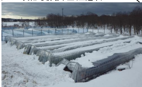
大雪によりハウスが倒壊し、水稻育苗ハウスでのとう菜(アスパラ菜)も栽培中止(上越市)