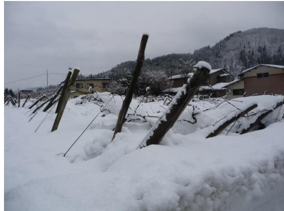
雪によるぶどう棚の倒壊(横手市)