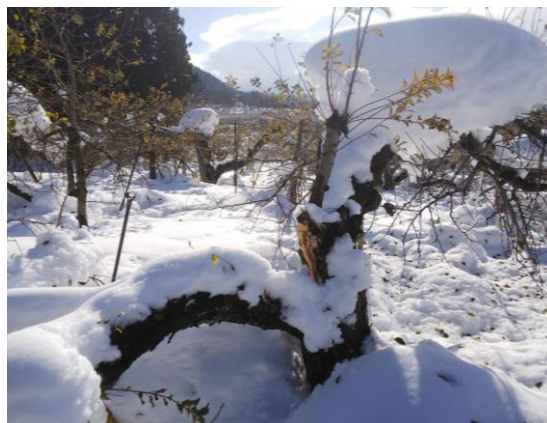
雪の荷重でリンゴの枝が裂開(湯沢市)