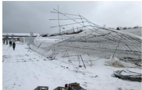
暴風雪により、すいか栽培用のパイプハウスが倒壊 (新潟市)