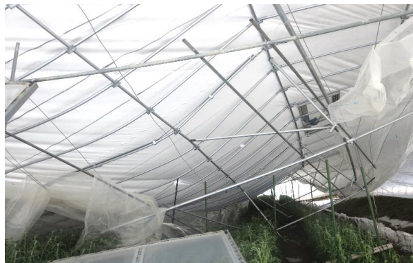
暴風雪でパイプハウスが損壊し、 花き(ストック)の栽培が中止(佐渡市)