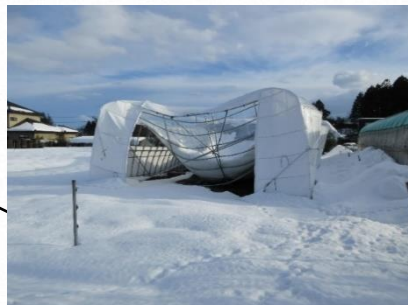
大雪によりパイプハウスが全壊(色麻町)