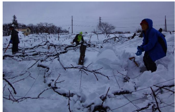
3mの積雪でぶどう棚が埋没し、 棚が損壊(上越市)