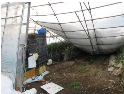
雪の重みでねぎ栽培用ハウスが全壊(加美町)