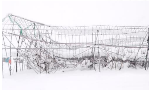
雪の重みでさくらんぼ雨よけハウスが全壊し、樹体にも被害(村山市)