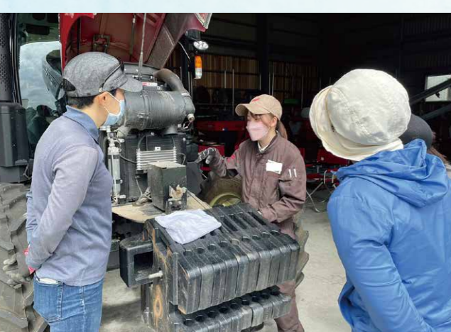
※スマート農業:ロボット技術やICT(情報通信技術)などの先端技術を活用し、超省力化や高品質生産などを可能にする新たな農業。

女性農業者支援プロジェクトとして始まった研修会。自社圃場では、もう今年の研修に向けた春作業の土起こしが始まっていた。