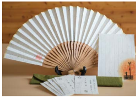
富貴紙製の名刺や扇子など

富貴紙は、釧路市音別地域に群生するフキの皮を原料とした日本唯一の和紙。山菜加工場で廃棄されるフキの皮の有効利用を目的に1991年に開発されたもので、パリッとした感触と緑色の風合いが特徴です。