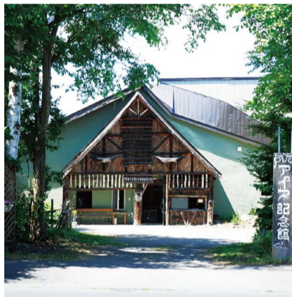
川村カ子トアイヌ記念館

「川村カ子トアイヌ記念館」(旭川市)、「二風谷アイヌ文化博物館」(平取町)、「サッポロピリカコタン」(札幌市)、「阿寒湖アイヌシアターイコロ」(釧路市)などでは、アイヌ古式舞踊や刺しゅう、ムックリ制作・演奏など、さまざまな体験ができて、アイヌ文化を気軽に楽しめる施設となっています。施設によって体験できる内容は異なりますので、詳しくは、右下のホームページまたは各施設のページをご覧ください。