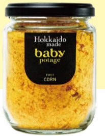
製造者: 滝上産業(株) デザイン: 寺島デザイン制作室