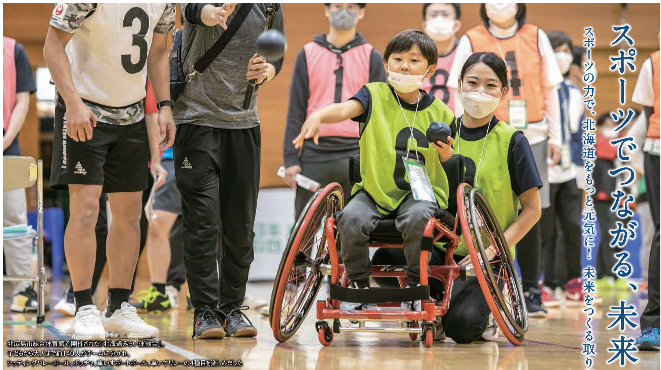
北広島市総合体育館で開催された「北海道みらい運動会」。子どもから大人まで約140人がチームに分かれ、シッティングバレーボール、ポッチャ、車いすポットボール、車いすリレーの4種目を楽しみました。