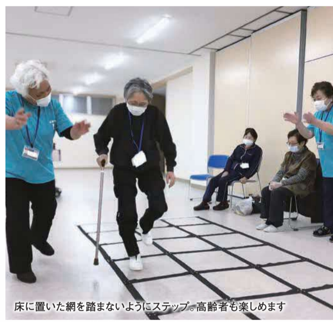
床に置いた網を踏まないようにステップ。高齢者も楽しめます