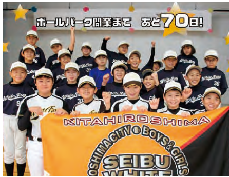
開幕戦カウントダウンを盛り上げよう