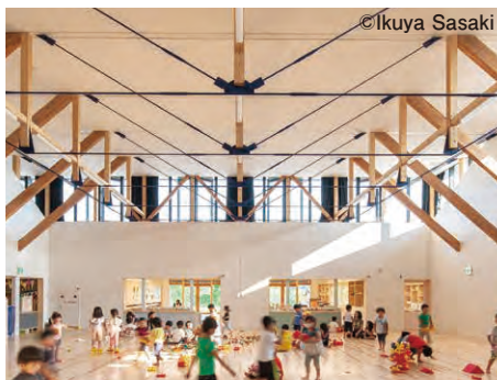
留学先の認定こども園「はぜる」の遊戯室

厚沢部町では、未就学児のいる家族の新たなワーケーションの形として、子どもの一時預かり制度とテレワークの可能な移住体験住宅、農作物の収穫などの生活体験を一体とした「保育園留学」に取り組んでいます。