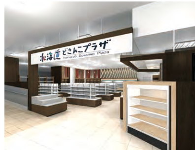
JR札幌駅西通り北口にある札幌店は2月1日リニューアルオープン