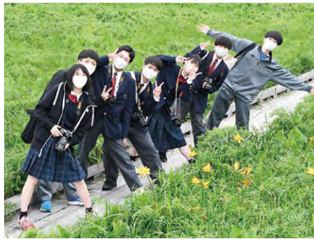
豊富高等学校3年生「地域PR班」