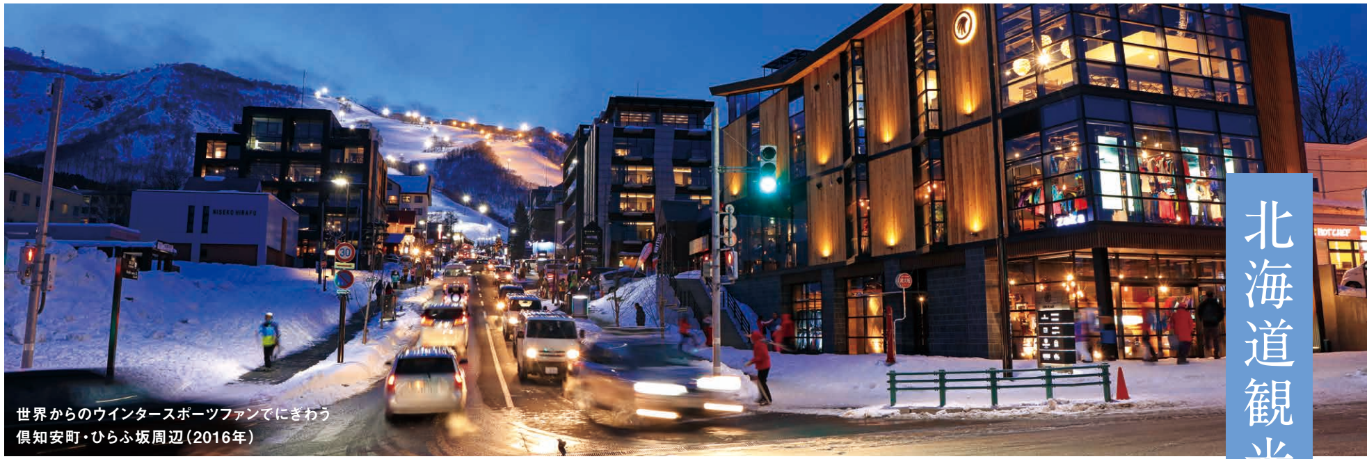
世界からのウインタースポーツファンにきわむ 倶知安町・ひらふ坂周辺(2016年)