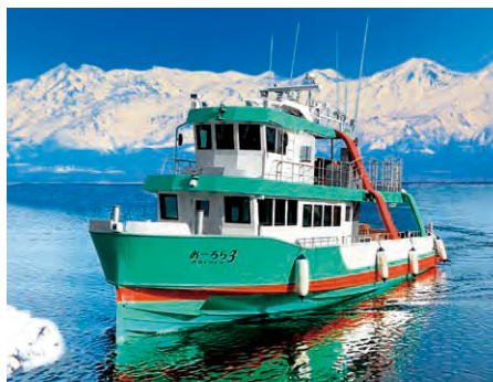
流水観光耐氷船「おーら3」