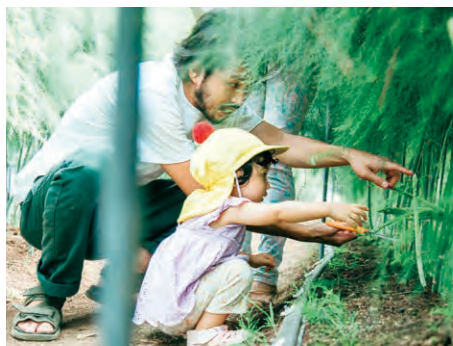
アスパラの収穫体験を楽しむ親子