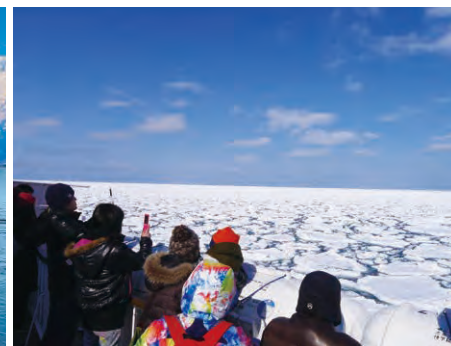
展望デッキから眺めた流氷(おーらから)

流水観光クルーズは、ことしの冬季運航から、新しい小型の観光船「おーら3」がデビュー。船体には通常の2倍も厚いアルミを使用し、流氷にも近づいて航行できます。