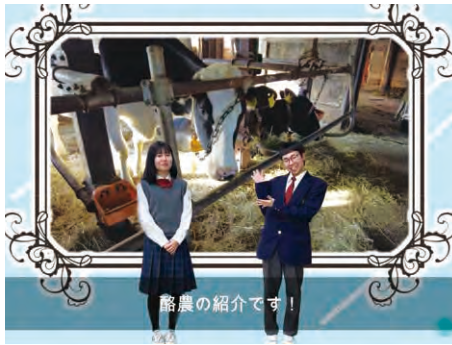
【PR動画】いいとこほうふとよとみちょう。

豊富町では町の魅力を発信するため、インスタグラムで「いいとこほうふ豊富町フォトコンテスト2022」を開催!