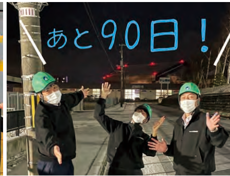
投稿写真には事務局で「あと〇日」を記載します

プロ野球・北海道日本ハムファイターズの新たな本拠地として、「エスコンフィールドHOKKAIDO」が、北広島市Fビレッジによいよ3月にオープン!!