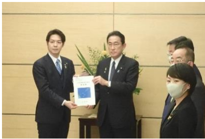
鈴木知事から総理へ要請