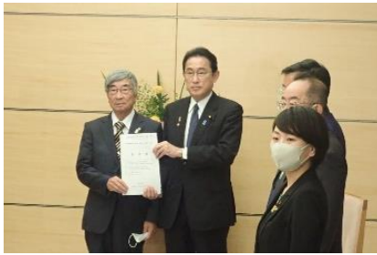
協理事長から総理へ要請