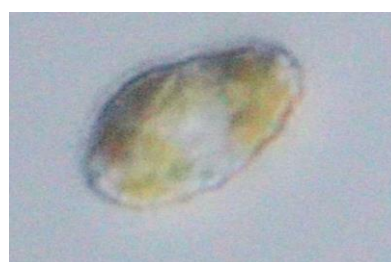
図3 確認された H.akashiwo の外観