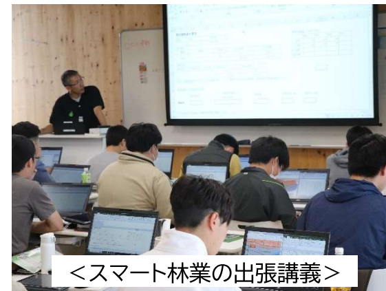
<スマート林業の出張講義>