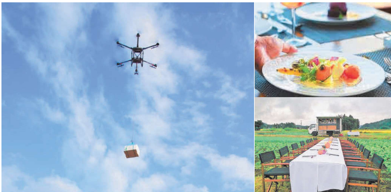
短距離物流用ドローン（苗木運搬ドローン）を活用して料理を配送

報道関係各位様には、是非とも「ドローンフレンチ配送実証実験」に注目していただき、取材いただけるようご協力の程、宜しくお願いたします。