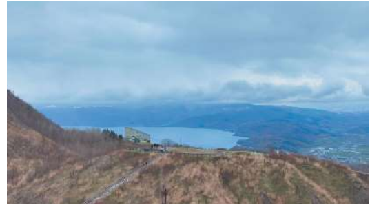
有珠山展望台で絶景の中で、北海道フレンチを提供する。