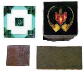
「すまい」を彩るタイル