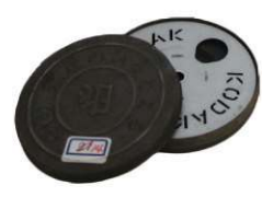
戦前・戦後の札幌を写した8mm映画フィルム