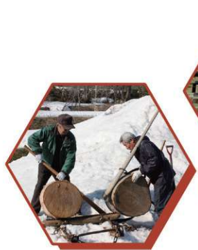
「トビ」など「馬追いの道具」の使い方を再現した映像