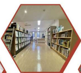
博物館のくつろぎスポット 図書室へようこそ!