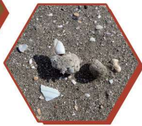
2021年に噴火した海底火山「福徳岡ノ場」由来の漂着軽石