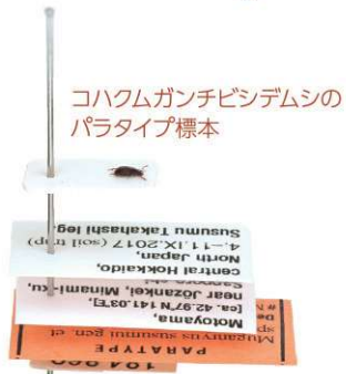
コハクムガンチビシデムシのパラタイプ標本