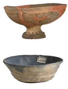
擦土土器 高坏(上)と坏(下)