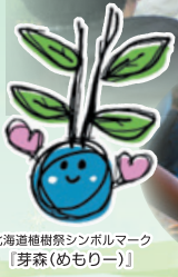
北海道植樹祭シンボルマーク 【芽森(めもりー)】