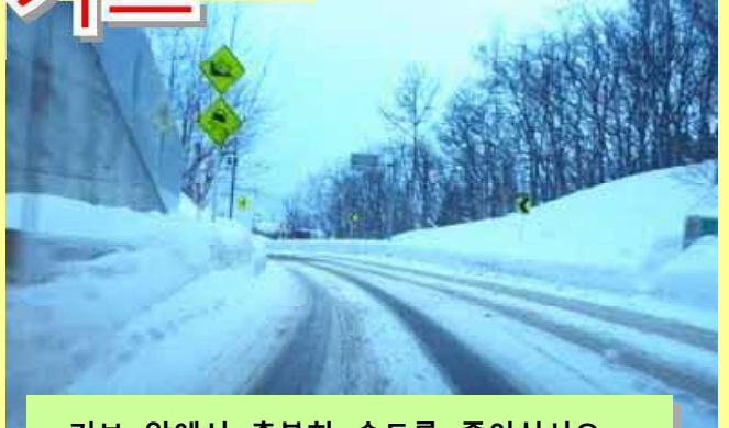
커브 앞에서 충분히 속도를 줄이십시오.