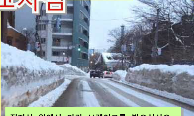
정지선 앞에서 미리 브레이크를 밟으십시오.