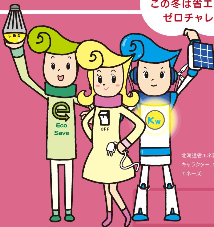
北海道省エネ新エネ キャラクターユニット エネーズ