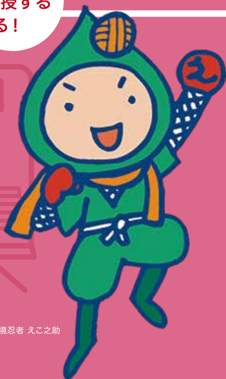
環境忍者 えこ之助