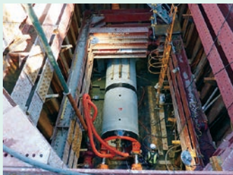
道路横断推進作業 (直径 1,350mm)