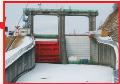
第一余水吐 (右側が1号ゲート)