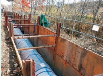
配水管布設作業 (直径 1,100mm)

今年度も昨年度に引き続き、第二施設幹線柏原地区において、約 1.8km にわたり耐震性の高いものに更新する工事を行っています。