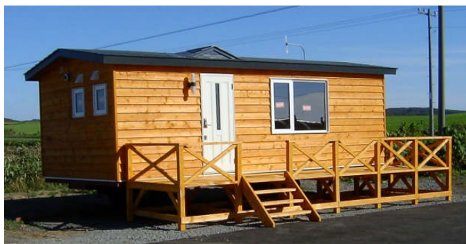
【トレーラーハウス】

この取り組みについては、第2期対策より実施し、平成21年度1組、平成23年度1組の新規参入者を確保することができ、着実に成果を残している。