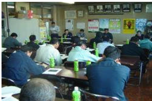
【集落の話し合い状況】

また、高齢化による農家戸数の減少に対し、認定農業者の育成及び新規就農者の確保のための体制づくりを推進する。