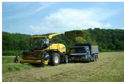
【コントラクターによる粗飼料収穫作業】