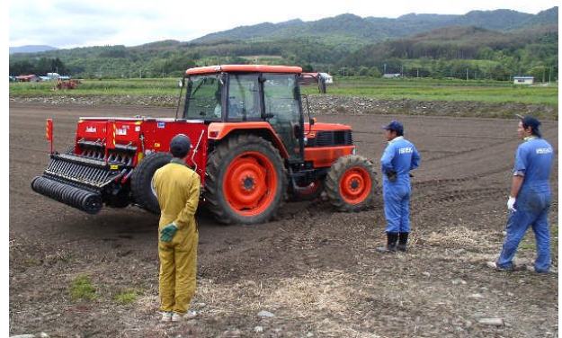
【作業受委託、共同作業】