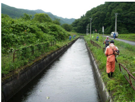
【共同による草刈り作業】

その他にも、水路の改修や農道のコンクリート舗装や、集落内の地域活動・行事にも積極的に取り組んでいる。