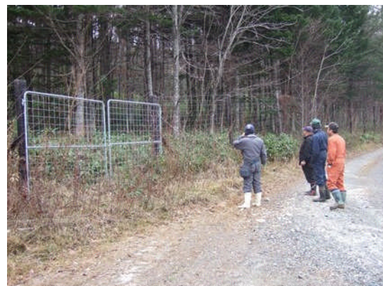
【エゾ鹿侵入防止柵の維持管理】