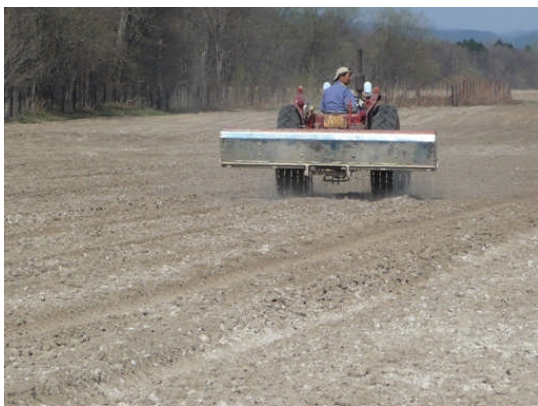
【土壌改良材の投入】