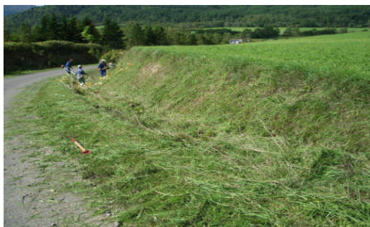
【法面点検と水路清掃】

また、経営規模拡大及び経営主の高齢化に伴い、粗飼料収穫作業の自己完結が難しくなっていること、並びに、良質粗飼料確保への意識が高まっていることから、中山間地域等直接支払交付金を活用して導入した大型共同機械を利用するとともに、担い手へ作業委託を進めている。このことにより、好天条件下で短期間のうちに円滑な作業を行う事ができるようになり、良質粗飼料の確保及び採草時の労働力の軽減が図られるようになった。