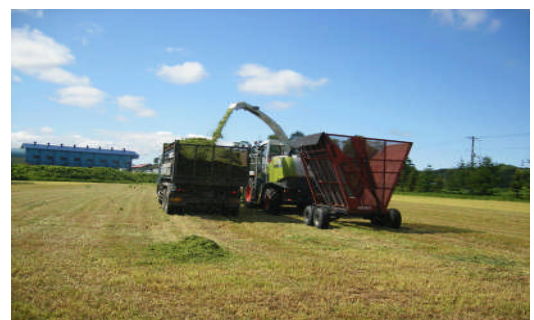
【大型機械共同作業】