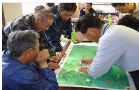
【 保全マップの作成 】

戸当りの平均耕作面積は、草地・畑あわせて24haであることから、小麦、甜菜、雑豆の畑作物に黒毛和牛の繁殖を取り入れ、有畜農業の確立を図っている。和牛は十勝和牛の中でも足寄和牛として、本州方面の肥育農家からは丈夫で良質な肥育素牛として安定的な評価を受けている。地形・面積から機械化による大規模農業には適していないため、機械の共同利用・共同作業、共同育苗など、各農家が集まって話し合いし、集落全体の生き残りをかけて、知恵と汗を出し合っている。