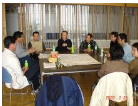
【 構成員による、意見の作業場 】