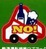
飲酒運転根絶ロゴマーク

飲酒運転根絶ロゴマークの使用をご希望の方は 公益社団法人北海道交通安全推進委員会のホームページから申し 込んでください。(無料) https://www.slowly.or.jp