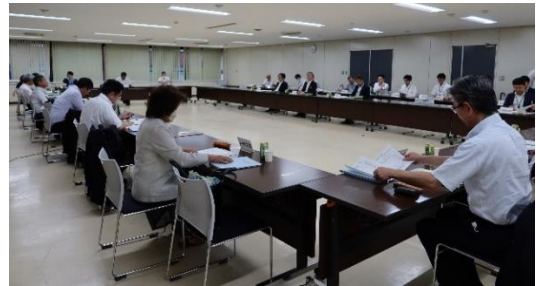
令和 5 年 8 月 8 日 森林審議会 （対面開催）