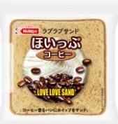
ほいっぷ コーヒー