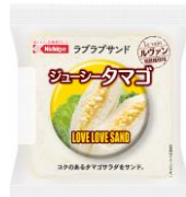
ジューシータマゴ