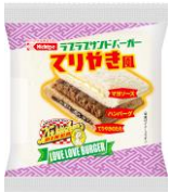
ラブラブサンドバーガー てりやき風