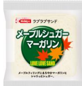
メープルシュガー マーガリン