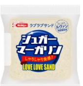
シュガーマーガリン