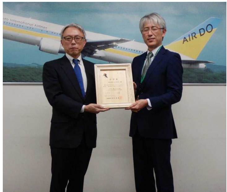
贈呈後の写真撮影

今回、令和5年12月20日に就航25周年を迎えられた記念の日に、25年前の就航初日の運航分（新千歳-羽田間3往復6便/日）の二酸化炭素排出量相当をオフセットするため、オフセット・クレジットを110t-Co 2 （道55t-Co 2 、石狩市55t-Co 2 ）購入いただきました。