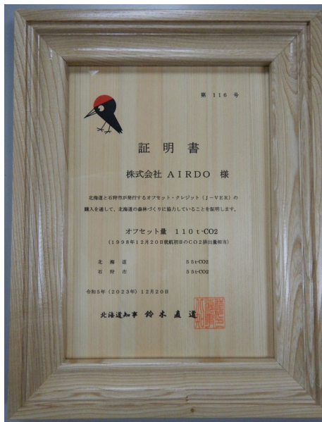
オフセット・クレジット証明書