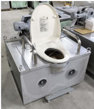
写真2 バイオトイレ本体