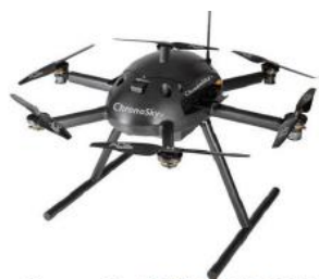
ChronoSky 搭載 ACSL-PF2