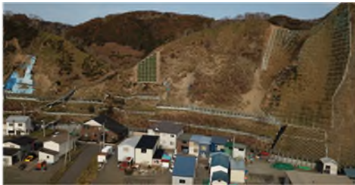
令和5年度時点施工状況