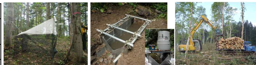
昆虫捕捉装置 (マレーストラップ)