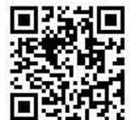
アワード公式サイト