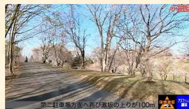
車いすでの移動負荷を伝える動画