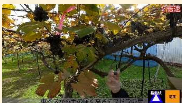
公園の様子を伝える動画

当事者意識に基づき地道な活動を継続している熱意や、学生の視点や社会に変化をもたらすことが期待される活動である点が高く評価された。