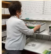
情報テープをダビング中