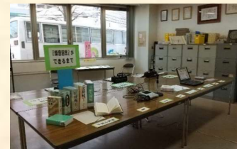
図書館まつりで 活動内容を紹介