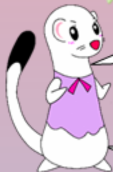
北海道労働委員会 公式マスコット「ジュリちゃん」

賃金未払、解雇、パワハラといった職場のトラブルにお悩みの方が 気軽に利用できる制度です。