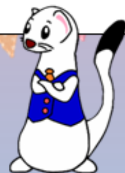
北海道労働委員会 公式マスコット「ローイ先生」