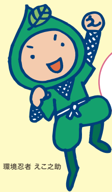
環境忍者 えこ之助