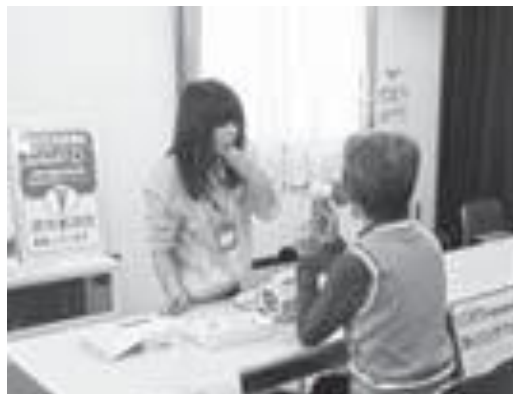
北海道健康づくり協働宣言団体 「公益財団法人北海道結核予防会」による スパイロメーターを活用した COPD(慢性閉塞性肺疾患) 予防啓発活動

参考：IPAG (International Primary Care Airways Group) 診断・治療ハンドブック日本語版