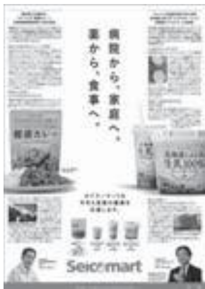
↑ 「北海道健康づくり協働宣言」企業 （株）セコマにおける野菜摂取の増加や減塩の取組