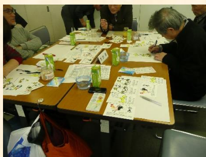
ふれあい年賀状作成会

平成12年から「ふれあい訪問活動」を毎年実施しており、地域に住む高齢者など見守りを必要とする方の自宅を福祉推進部会員が訪問し、災害などの避難時のお手伝いをすることや日常生活のなかでの相談ごとを聞くなど、顔の見える支援を目指している。このほかに、「ふれあい訪問活動」を行いやすくするために、「健康講座とふれあい昼食会」、「ふれあいサロン作り」、「ふれあい年賀状作成会」なども実施している。これらの活動は、高齢者や障がいのある方、地域住民が年齢や障がいを問わず住民相互のつながりと支え合いの形成を図っている。今後も地域の交流をすすめ、地域の絆を深めるよう活動を行うことが期待され、高く評価された。