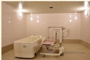
特別浴室の機械浴槽（