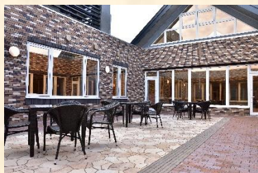
共同生活室に面した中庭

この建物は、個室を中心に3つのユニットから構成され、建物も家庭を意識した意匠性となっており共有スペースはゆったりと開放的で、各ユニット間の職員の動線も配慮され認知症の人でも安心して暮らすことのできる居住空間となっている。施設の整備基準を概ね満たし、昨年の台風による大雨の際も盛り土をしたところに建設されていることから浸水することなく、自家発電設備を屋上に設置し災害に強い建物となっており安心・安全に配慮した整備内容となっている。また、建設時において地域住民の声を反映し、認知症カフェのできる設備や空間があり、地域の人たちの専用の出入り口があるなど地域との交流を積極的に行っていく配慮がなされているなど、高く評価された。