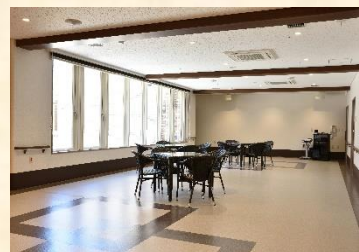
地域交流・研修スペース