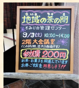
地域の茶の間看板