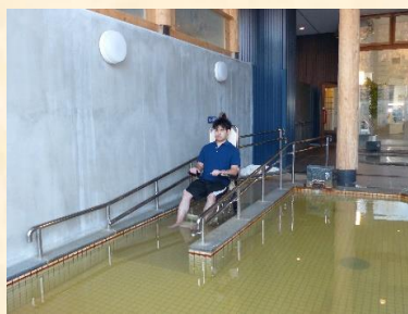
露天風呂・油圧式シャワーチェア