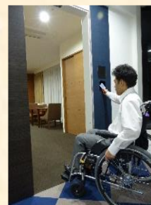
カード Key をかざし部屋へ