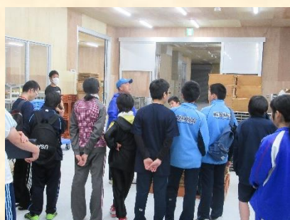
行事に参加中の様子1

宗谷管内特別支援学級生徒が校外宿泊学習を通し、日常生活の自立、職場実習体験により、就職、社会参加に向けて大きな効果を上げているところが評価された。