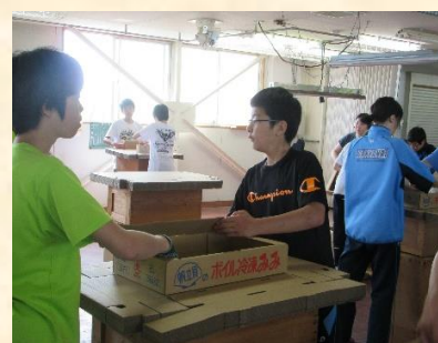
行事に参加中の様子3