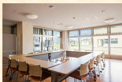
機能訓練・会議研修室