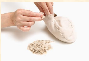
調整口からの詰め替え