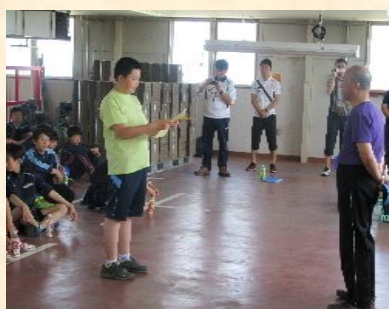
行事に参加中の様子2