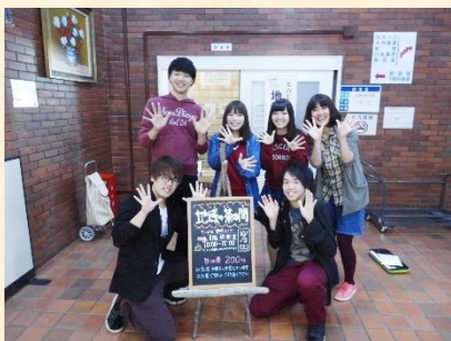
出演学生の皆さん

参加人数も増加しており、今後も世帯間交流をすすめ地域の絆を深めるよう活動を継続していく。地域交流の促進しているところが評価された。