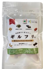
ギルフリ （株）医食同源

3種類のナッツ（アーモンド、 カシューナッツ、くるみ）は いずれも食塩不使用。 小腹が空いたときや夜のお酒 のおつまみなどにおすすめ。