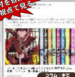
コラム：本で楽しむ開拓史