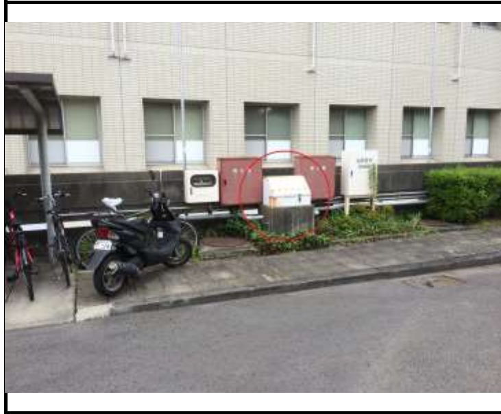
写真2 給油口ボックスの位置