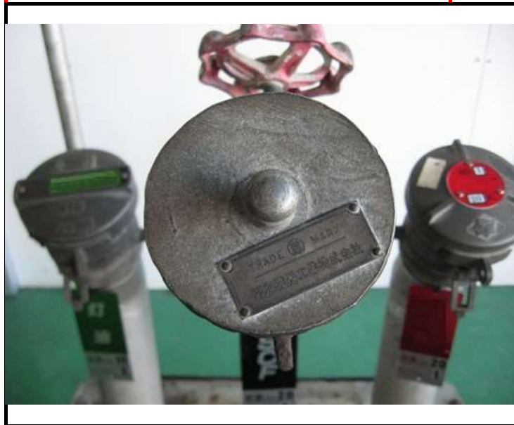
キャップを撮影 型番が刻印されている場合あり