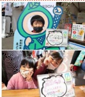
▲ゼロカーボン北海道フオトスポットの様子

▼石狩管内の情報をウェブサイト「いしかり地域ゼロカーボン」でひとまとめに！ ページ開設！ 石狩管内市町村や振興局の取組のほか、事業者向けの支援情報やお知らせするウェブサイトを開設しました。随時更新しておりますので、こちらもチェックしてください！