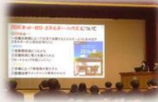
▲校内発表会の様子

どのグループも「ゼロカーボン」を自分たちの身近な問題と捉え、具体的な取組の提案をするだけでなく、今回の成果を生徒会活動や校内全体に展開したり、校内発表会で地域住民に向けた「ゼロカーボン」についての提案を発表したりするなど、学校でも地域でも「ゼロカーボン」が浸透していきました。