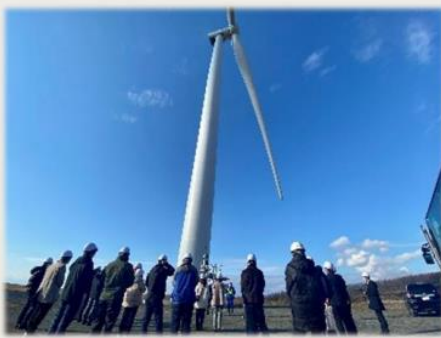
▲ 浜里ウインドファーム(幌延町) 宗谷管内は道内でも有数の風力発電量を誇る地域です。

令和4年11月に企業や経済団体、市町村等を対象としたバスツアーを開催しました。バスツアーでは風力発電施設、紙おむつ燃料化施設、廃棄物リサイクル施設などを見学しました。また、令和5年度には、北海道の将来を担う若い世代に対して普及啓発などの取組を進めていきます。