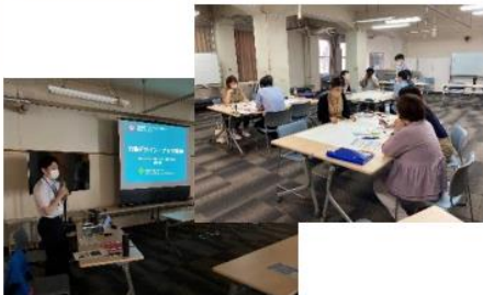
▲行動デザイン・ナッジ理論研修の様子

☆ナッジとは・・・？ 行動科学の知見を活用し、人々が自分自身もしくは社会にとってより良い選択を自発的に取るように手助けする政策手法です。