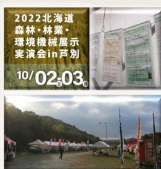
▲2022北海道森林・林業・環境機械展示実演会in芦別

道と包括連携協定を結んでいる日本生命保険相互会社様と連携し、道民の皆様や民間事業者の皆様へ「ゼロカーボン北海道チャレンジプロジェクト」の実践を呼びかける情報発信を行ったほか、CHB北海道木質バイオマス機械協議会様主催の「2022北海道森林・林業・環境機械展示実演会in芦別」においてパネル展示を行いました。