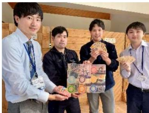
▲ゼロカーボンひやまチャレンジチーム

今後は、ボードゲームを使ったイベントの開催、小中学校等への出前授業、管内の学校や一般の方への貸出しなど、幅広く活用を広げていく予定です。