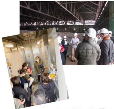
▲ フィールドワークの様子

令和4年10月6日に留萌管内の風力発電施設と資源ゴミリサイクル施設、埋立ゴミ施設の実地調査をしました。参加者は燃える埋立ごみに含まれるプラスチックゴミの多さにショックを受けていました。