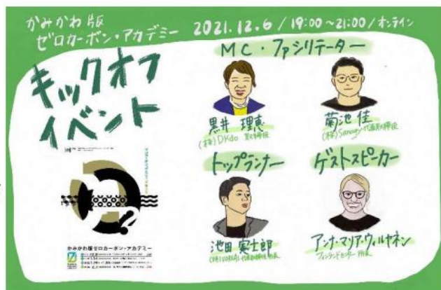
▲キックオフイベントのチラシ

その後、参加者、オンライン視聴者と意見交換し、アイデアの実現に向け、思いを一つにしました。