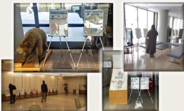
▲市町と連携したパネル展示(深川市・妹背牛町・北竜町・沼田町)

ゼロカーボンシティ宣言をした市町から順に開催し、今後、管内全市町で開催する予定です。