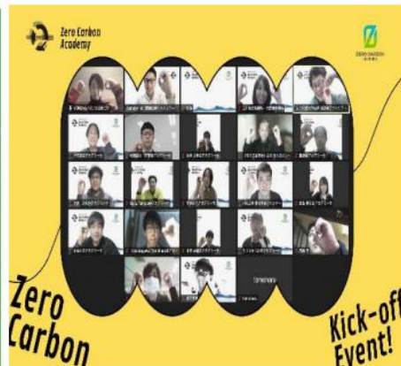
▲キックオフ時の参加者の皆様