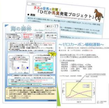
▲各チーム作成資料の一部

すでに一部のアイデアは、振興局事業として実行しています。また、本部（ゼロカーボン北海道推進本部）にも提案しており、本庁の事業の参考としても活用されています。