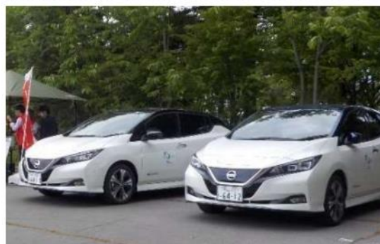
▲ 体験試乗会で活用した電気自動車

エネルギーをシェアリングする先行事例等について知見を深め、体験試乗会では、EVの操作性、安全性、耐久性などを体感。下車後は、災害時に非常用電源として活用するデモンストレーションを見学した。参加した市町村職員からは「導入時には、充電設備の数や配置など、駐車スペース全体のレイアウトを総合的に考える必要を感じた」など、公用車としての導入に向けた具体的なイメージを語る声も聞かれた。研究会では今後も、管内におけるEV普及の課題の抽出や、公用と民用のEVカーシェアリングの可能性などについて地域と連携しながら調査と研究を進めていく予定です。