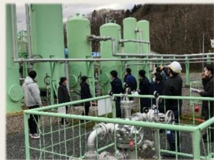
▲ 豊富鉱山(豊富町) 天然ガスのコージェネレーションシステムを導入し、鉱山施設の電力を賅うとともに、廃熱を温泉水の加温に利用し、各宿泊施設に供給しています。