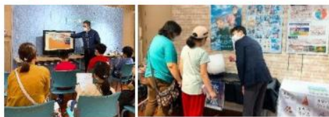
▲ 流水ミニ講座の様子