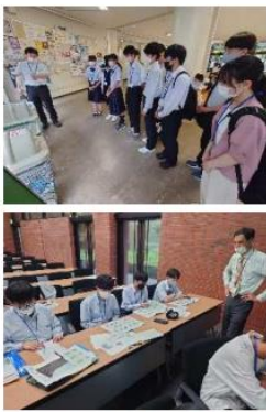
▲ プレワークショップの様子

令和4年7月1日に北海道大学のキャンパス内で、関係する教授陣からSDGsの基本的な知識を学ぶとともに、風力発電に関わる企業の方から、風車の有用性やリスクについての説明をいただきました。