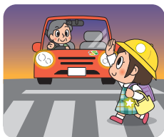
歩行者を優先しよう! 早めにライトを点灯しよう!