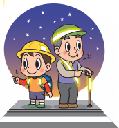
左右を確認しよう!