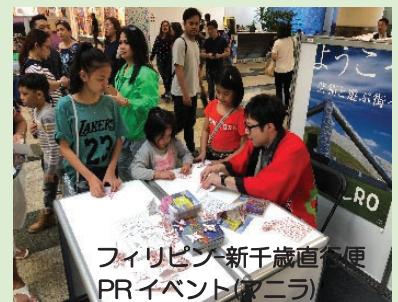
フィリピン新千歳直便 PRイベント(マニラ)