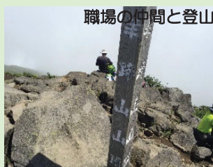
職場の仲間と登山

数年おきに転勤することは、その地域毎の魅力を発見できるので、悪いことばかりではありません。また、プライベートと仕事の両立も十分可能ですので、ぜひ一緒に北海道庁で働きましょう！