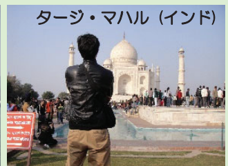
タージ・マハル(インド)