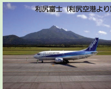
利尻富士(利尻空港より)