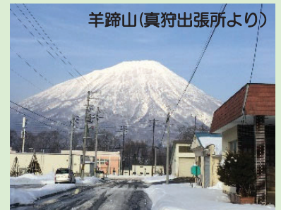
羊蹄山(真狩出張所より)

現在は、建設部建設政策局建設政策課に配属され、北海道の社会資本整備の推進のため、国土交通省や財務省、道内選出国会議員の方々へ要請活動を行ったり、建設部内の国費事業の取りまとめを行っております。